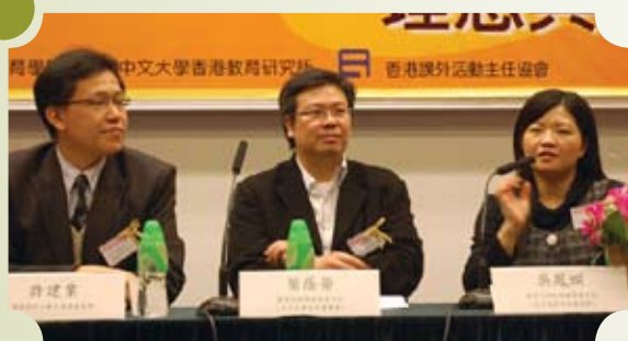
講者和本會主席回應同工的提問