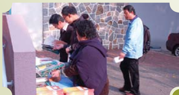
本會曾經出版之刊物