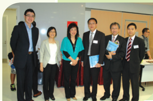
本會首次與香港青年協會合辦週年研討會，充份利用社會資源。