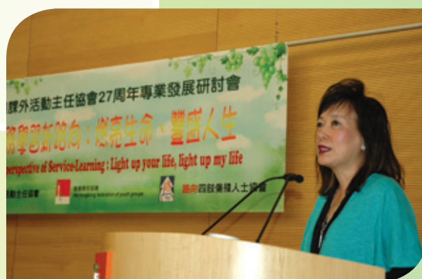
香港青年協會總幹事王芻鳴博士向老師分享青年教育經驗。

廿一世紀的青年人必須擁有下列五項特質：自學能力、良好的人際關係、解決困難的能力、溝通能力、創造力，才能適應現今急遽轉變的社會形態，與時並進。