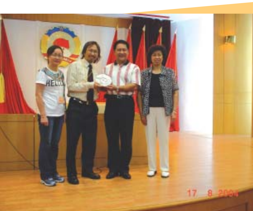
曾永康博士致送紀念品予廣州市政協副主席陳紀萱先生