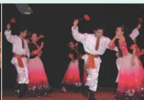
閩僑中學的中國舞「當玫瑰花盛開的時候」