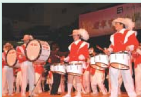
香島中學的「紅天使管樂步操」