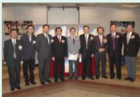
部份嘉賓及歷屆主席