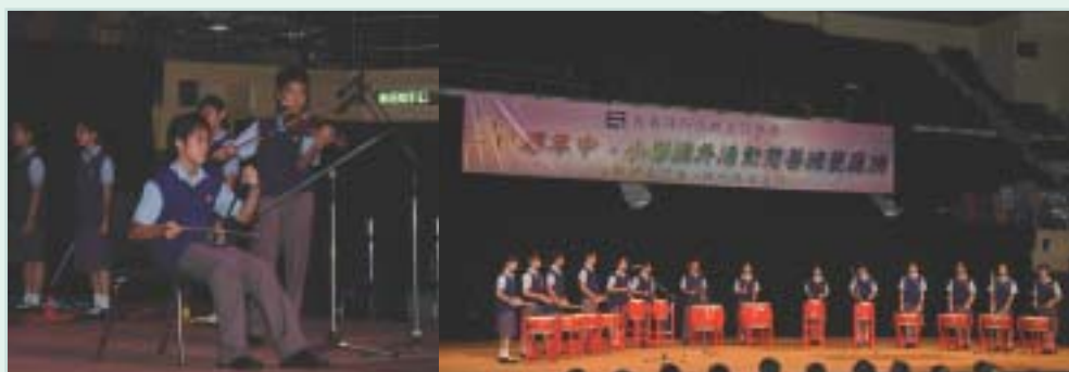
中華基金中學的中國鼓合奏及弦樂二重奏