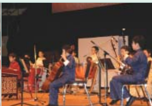
喇沙小學中樂團演奏