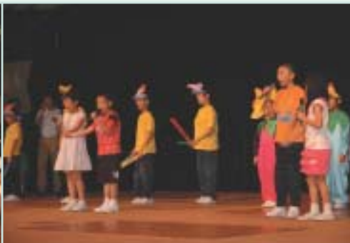
路德會救主學校表演創作舞蹈及音樂劇