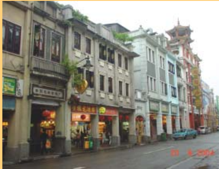
廣州市上下九路步行街的古建築物