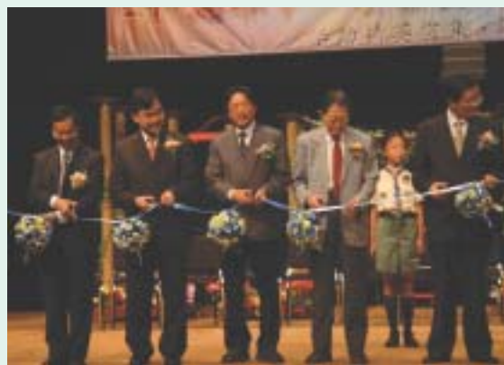
主禮嘉賓及歷屆主席齊集剪綵

「二十週年中、小學慈善綜藝匯演」得以成功舉行，實多謝各會員學校鼎力支持及參與演出，讓匯演生色不少。而同學們表演的水平實在高超，精彩不已，現將其中精華照片剪輯下來，讓會員們仔細欣賞：