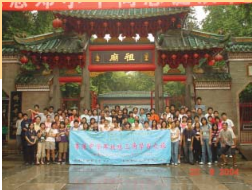
集體合照於佛山祖廟

其實，學習之旅能順利完成，除了籌委們的辛勞外，乃得到香港青年事務委員會資助，香港教育工作者聯會協助聯絡安排及廣州市政協鼎力支持，在此謹致謝意。最後，更多謝一批熱心教育及關心學生的各校領隊老師，感謝大家無償的付出。