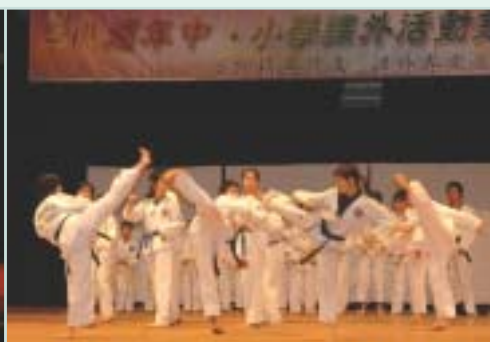
國際跆拳道香港總會的示範表演