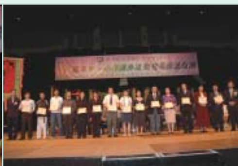
演出學校校長及代表接受紀念品