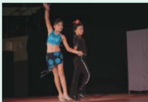
香港真光中學小學部的拉丁舞表演