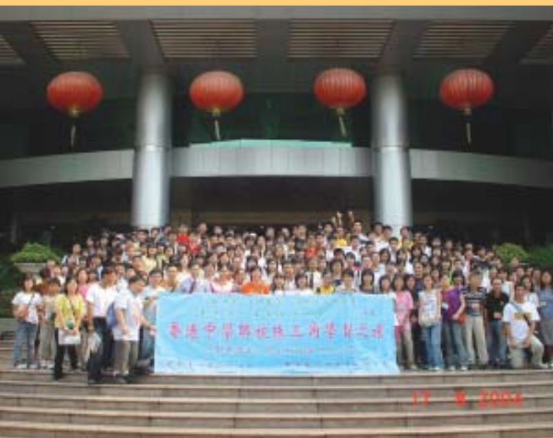
於廣州市政協會議廳正門集體合照

經過課外活動主任協會及「愛我中華建樹香江」國民教育協進會的通力合作，籌委會多月來的籌備，香港中學聯校珠江三角洲學習之旅終於踏上旅途了。筆者於今年八月十七至廿三日，與本會主席曾永康博士帶領十多間中學師生，共約二百人，前往廣東省廣州市、清遠市、佛山市及順德市等地展開三角洲學習之旅。