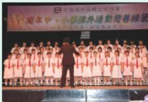
嘉諾撒聖心書院高級合唱團獻上大合唱