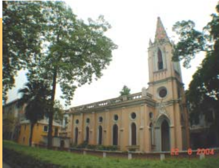
廣州市沙面古天主教堂