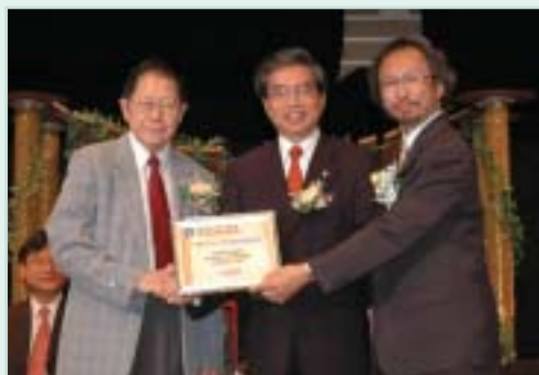
教統局首席教育主任 潘漢雄先生(中)接受紀念品