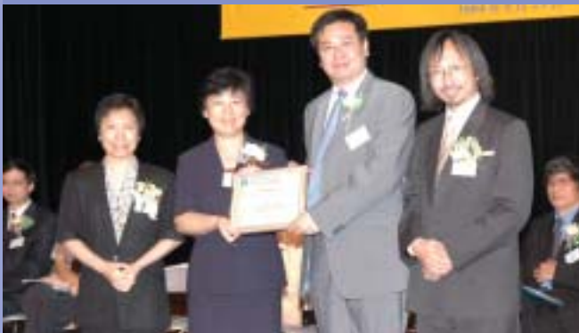
主禮嘉賓中聯辦教科部董翠娣處長致送紀念品予教統局總課程發展主任葉蔭榮先生

推行全校性全方位學習一段時間後，校方應檢討改善方向及加強學校與學校之間的合作。這是葉先生所提供關於推行全方位學習時的改善方法。