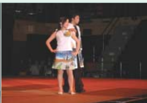
仁濟醫院董之英紀念中學的時裝表演 「下一站·彩虹」