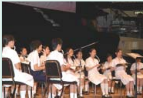
德愛中學的口風琴演奏