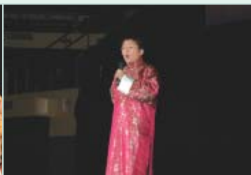
德信中學同學獻唱粵曲