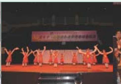
油麻地天主教小學(海泓道)的中國舞和非洲鼓表演