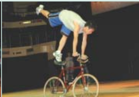
仁濟醫院董之英紀念中學的花式單車表演