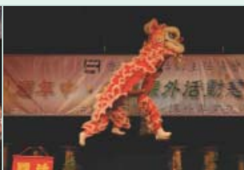
陸智夫國術總會帶領同學們演出的「夜光龍獅匯演」